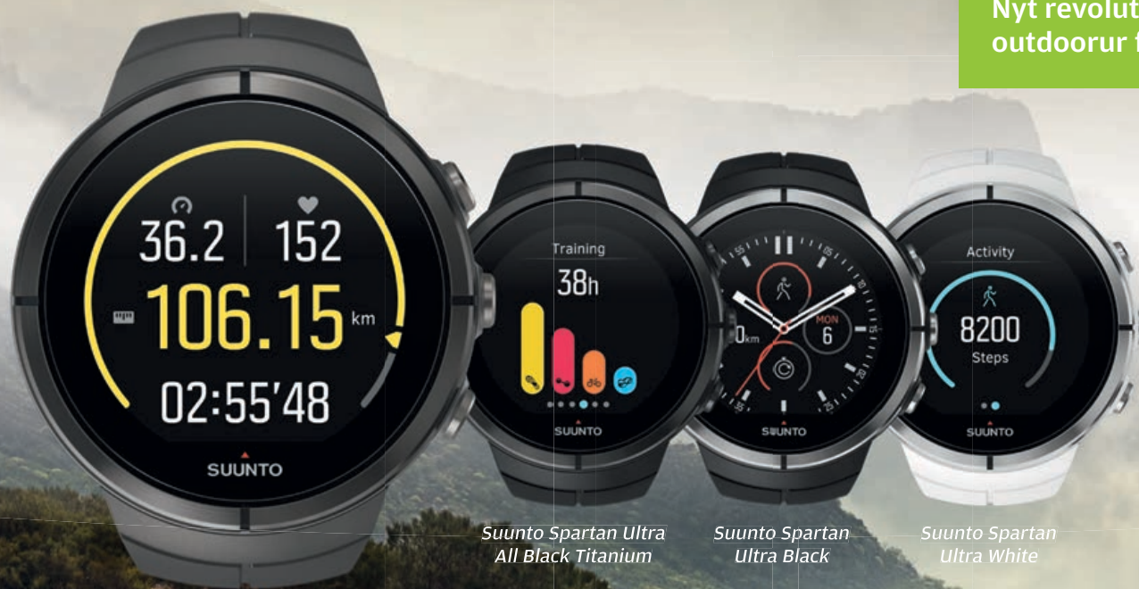
Suunto Spartan Ultra Stealth Titanium

Nyt revolutionerende outdoorur fra Suunto!