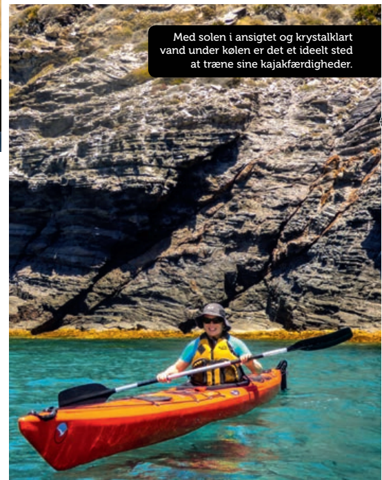
Med solen i ansigtet og krystallkært vand under kølen er det et ideelt sted at træne sine kajakfærdigheder.