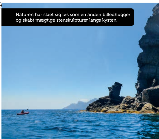
Naturen har slået sig løs som en anden billedhugger og skabt mægtige stenskulpturer langs kysten.