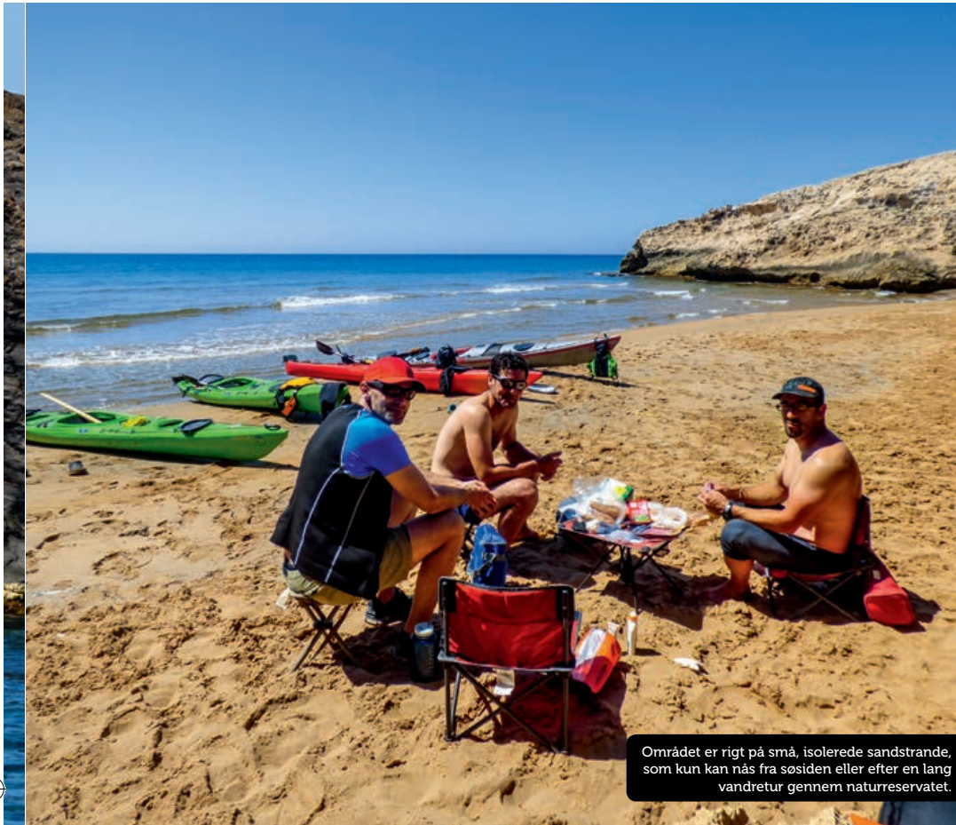
Området er rigt på små, isolerede sandstrande, som kun kan nås fra søsiden eller efter en lang vandretur gennem naturreservatet.