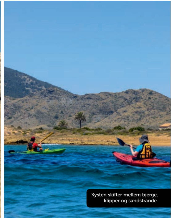
Kysten skifter mellem bjerge, klipper og sandstrande.