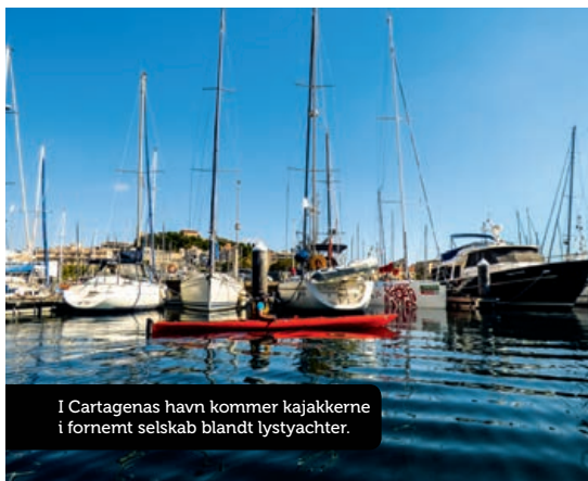
I Cartagenas havn kommer kajakerne i fornemt selskab blandt lystyachter.

under vandoverfladen, er skyld i, at dykkere nu har så mange vrage at dykke på i dette område. Bag os ligger kappets fine fyrtårn, mens vi padler sydvestover langs den forrevne klippekystlinje, hvor klipperne kaster sig i havet som silhuetter i flere lag bag hinanden.