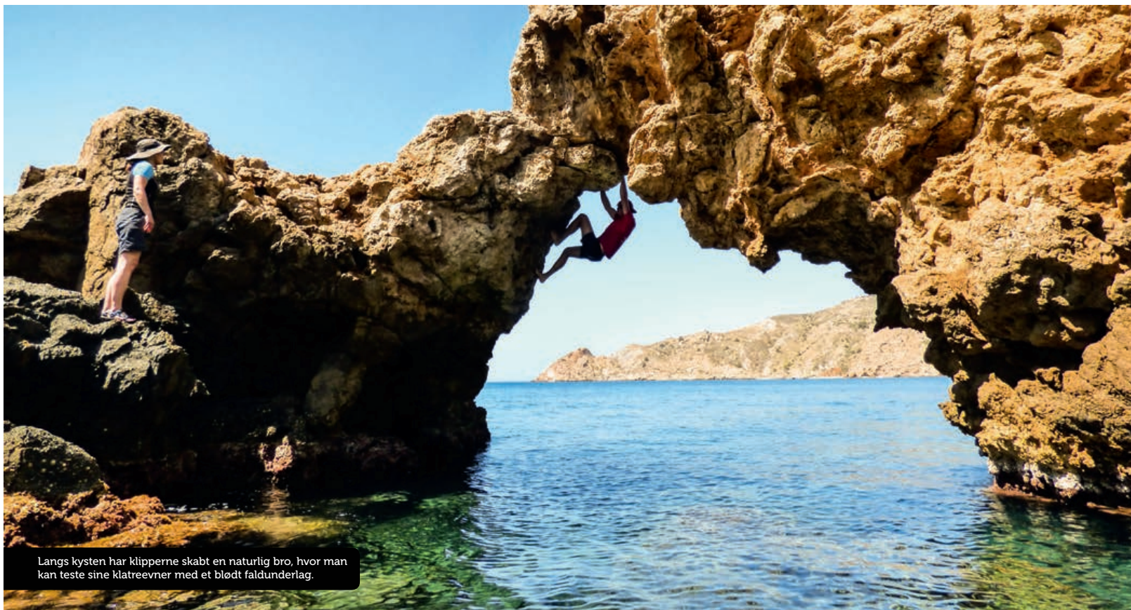
Langs kysten har klipperne skabt en naturlig bro, hvor man kan teste sine klatreevner med et blødt faldunderlag.