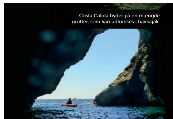
Costa Calida byder på en mængde grotter, som kan udforskes i havkajak.